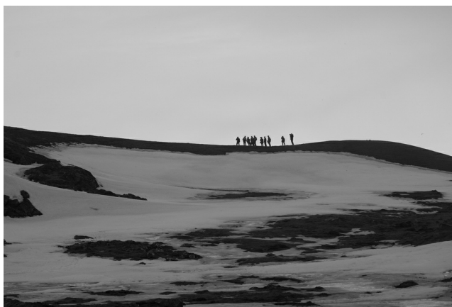
© Filip T. J. J. J.

We kregen wel fantastische fotokansen van (alweer) noordse stormvogels en vier grote burgemeesters die het schip volgden, drieteenmeeuwen en kleine alken.